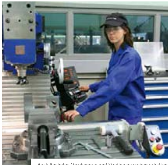
Auch Bachelor-Absolventen und Studienaussteiger erhalten nun Zugang zur Meister- bzw. Aufstiegs-Förderung.

ab August 2016 noch mehr Fortbildungsteilnehmerinnen und -teilnehmer vom Aufstiegs-BAföG profitieren.